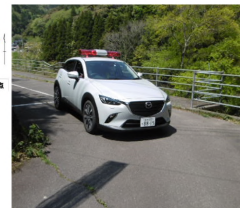
警報車による巡視