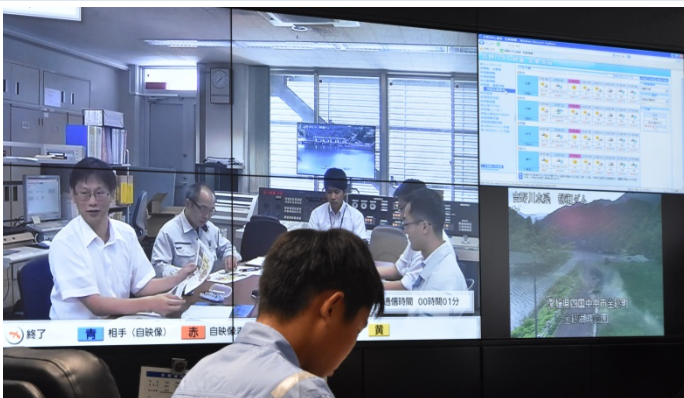
テレビ会議でダムの状況報告をする様子

○当日は、吉野川ダム統合管理事務所で任命書の交付を行い、事務所長として、柳瀬ダムとテレビ会議を行い管理状況を確認したり、池田ダムや香川用水取水工の見学をして頂きました。