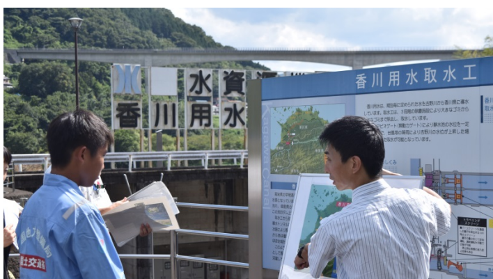
香川用水取水工見学の様子