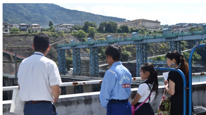
池田ダム見学の様子