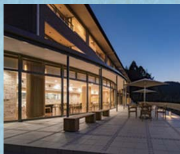
さめうら荘レイクサイドホテル

レストランを併設したホテル「さめうら荘レイクサイドホテル」が平成30年にリニューアルオープン、民間活力による拠点施設「さめうらカヌーテラス」が令和2年9月にオープンし、「さめうらレイクタウン」としてさめうら湖の自然体験型観光の拠点と位置づけられています。 湖面やその周辺を利用したカヌーやサップ、サイクリングなどのアクティビティ、道の駅や森林公園との連携イベントを楽しめます。