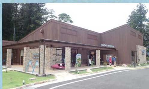
モンベル アウトドアヴィレッジ本山

帰全山公園の近くには、民間活力による「モンベル アウトドアヴィレッジ本山」が令和元年7月にオープンしました。 飲食・物販や、ラフティング、カヤック、サップ等を始めとする様々なアクティビティ運営が行われています。