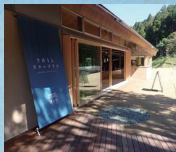
さめうらカヌーテラス