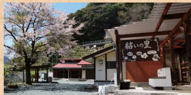
村のえき（結いの里）

「村のえき（結いの里）」は、大川村の観光の玄関施設です。 近隣の情報が豊富に揃っているほか、採れたての農産物や地元の加工品の販売もあり休日には物産物を味わえる食堂もオープンします。 湖畔では観光遊覧やワカサギ釣りクルーズ等の運営が行われます。また、森の駅との連携イベントも楽しめます。