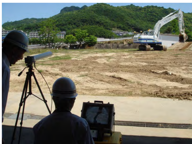
ラジコンバックホウの 遠隔操縦訓練