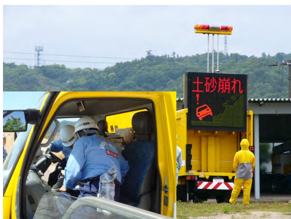
標識車の標識表示