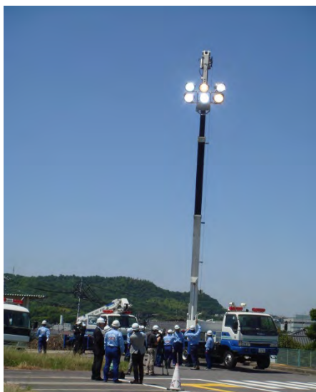
照明車の設営訓練