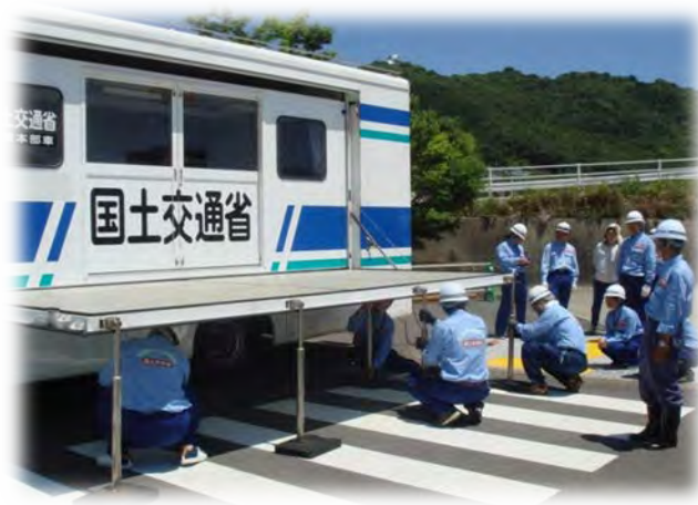
対策本部車の設営訓練