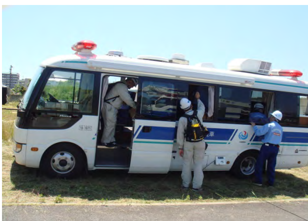
待機支援車の設営訓練