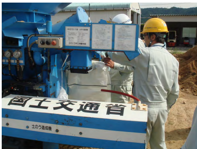
土のう造成機による土のう作製訓練