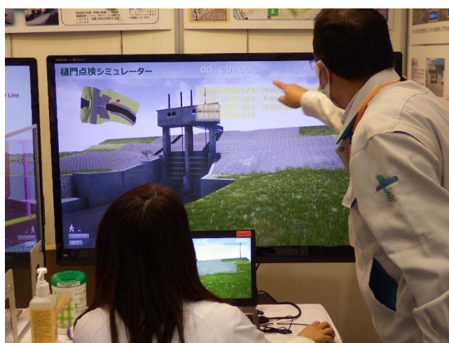
▲樋門点検シミュレーターを体験する来場者