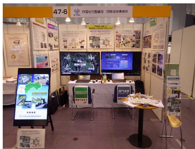
▲四国技術事務所の出展ブース