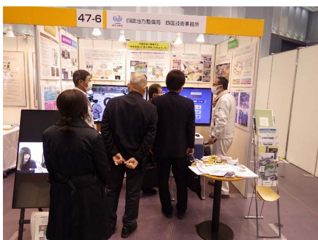
▲興味深く説明を聴く来場者