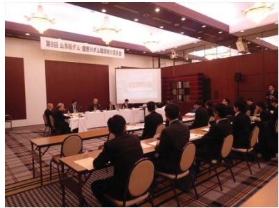
第10回 山鳥坂ダム・鹿野川ダム 環境検討委員会