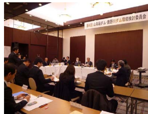
第4回 山鳥坂ダム・鹿野川ダム環境検討委員会