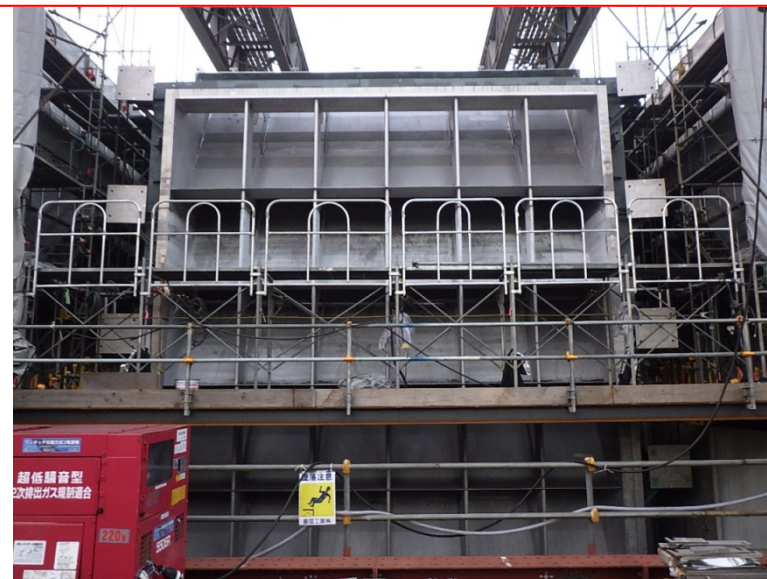
12月14日 サイホン管 据付