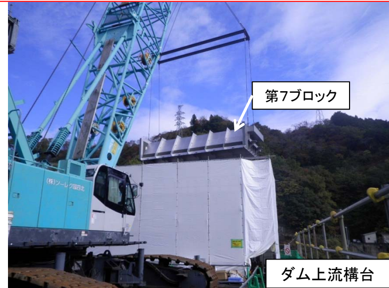
11月9日 サイホン管 組立・据付