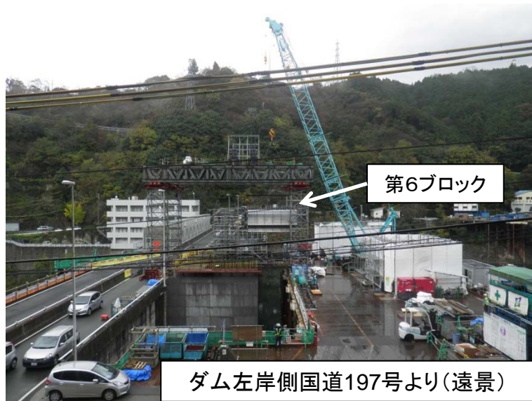
11月16日 サイホン管 組立・据付