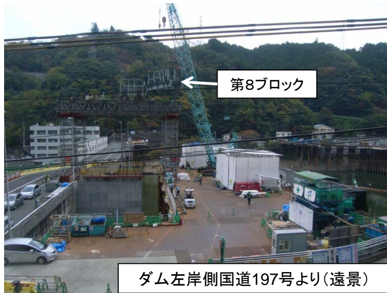
11月2日 サイホン管 組立・据付