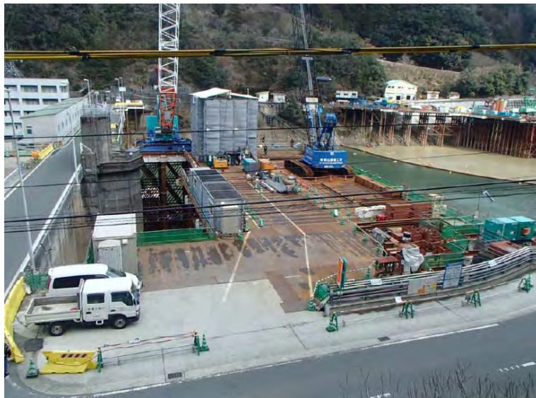
2月17日 仮設構台設置