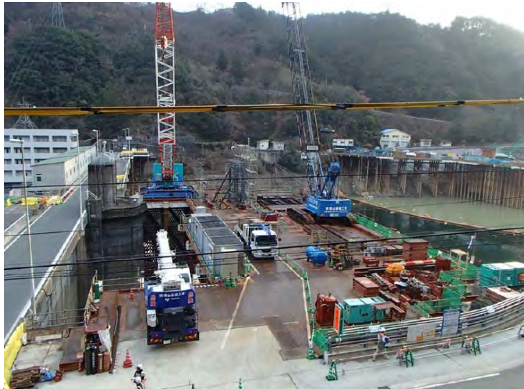
2月3日 仮設構台設置