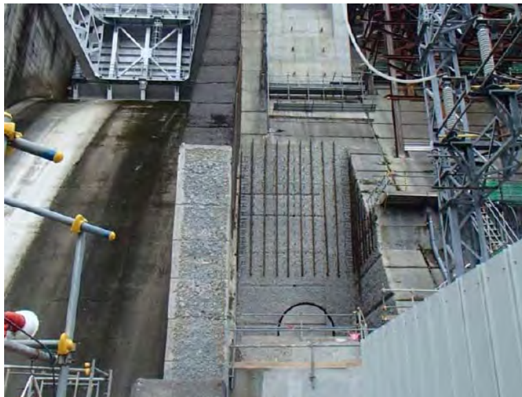
2月17日 削孔作業準備中