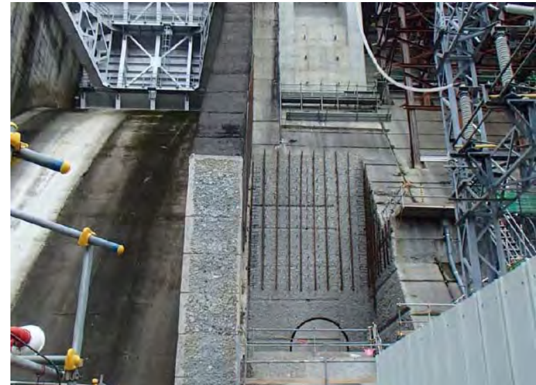
2月10日 削孔作業準備中