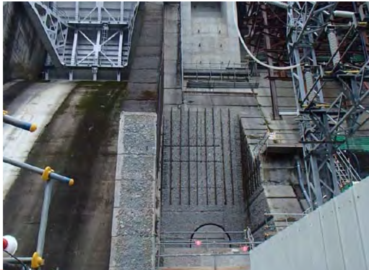
2月3日 削孔作業準備中