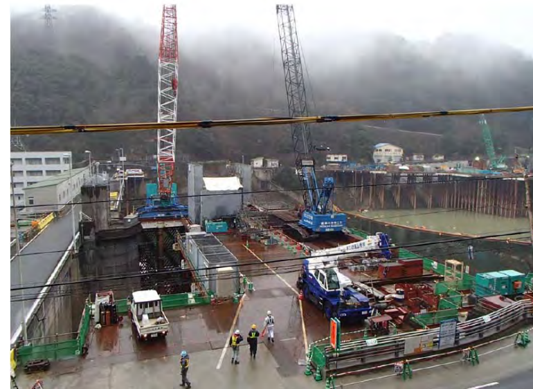
2月10日 仮設構台設置