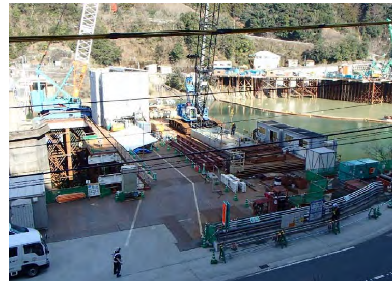
2月24日 仮設構台設置完了、機材撤去