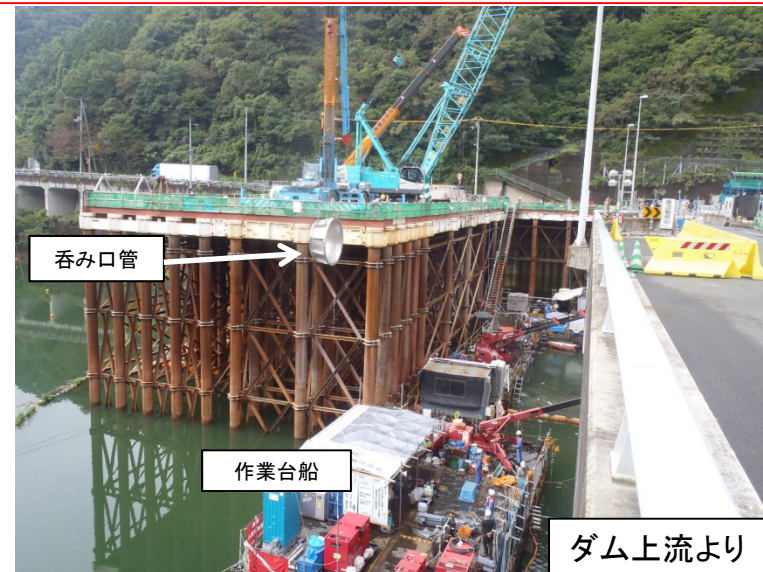
9月8日 チャンバー呑口管据付