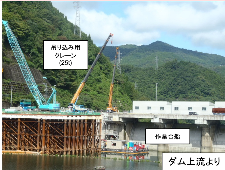
9月1日 予備ゲート戸当り据付