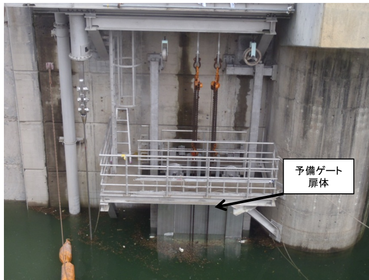
9月16日 予備ゲート扉体吊り込み