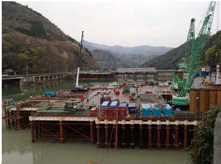
4月7日 仮設構台設置、呑口立坑掘削