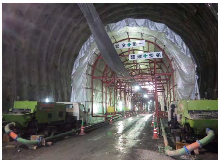
4月21日 インバート工、覆工