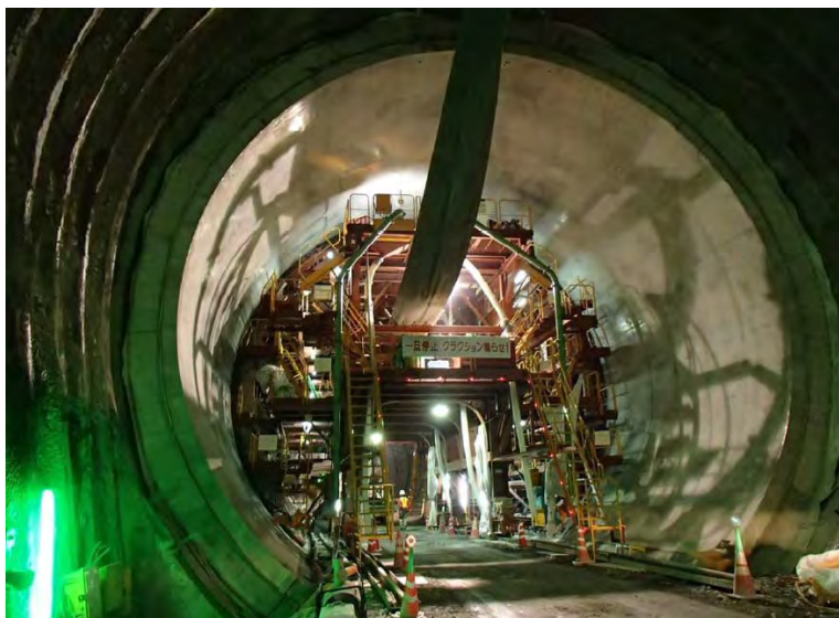
4月7日 インバート工、覆工