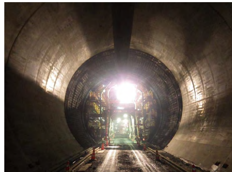
4月28日 インバート工、覆工