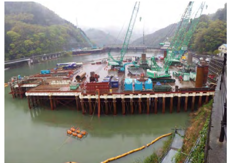
4月14日 仮設構台設置、呑口立坑掘削