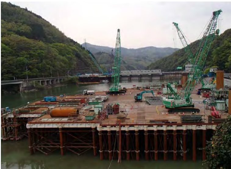
4月21日 呑口立坑掘削