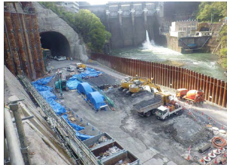
4月28日 トンネル工準備作業