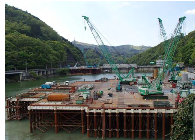
4月28日 呑口立坑掘削