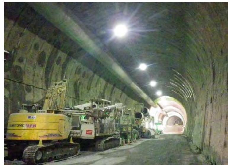
7月8日 上半掘削 248m 下半145m 基礎114m