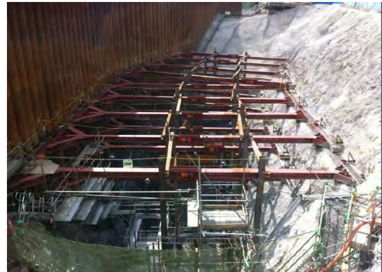
7月8日 鉄筋組立、コンクリート打設