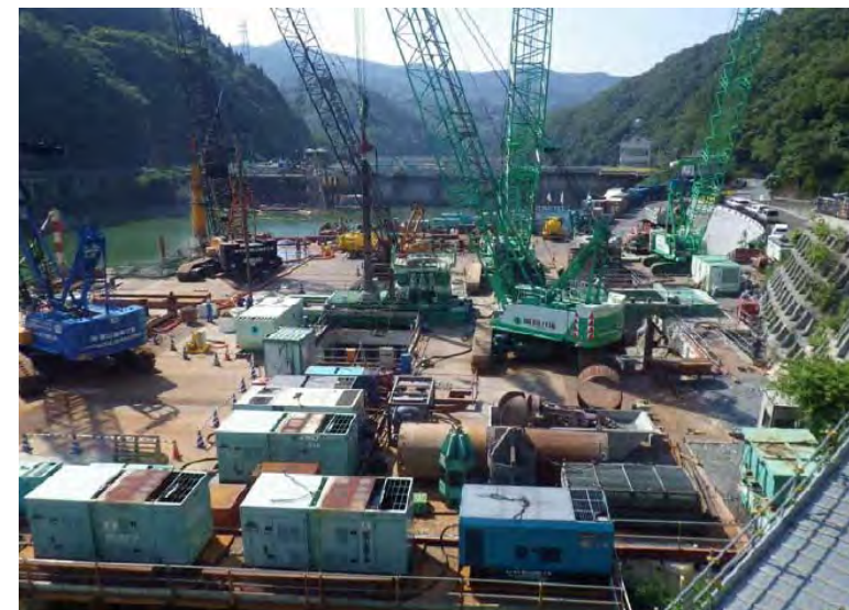
7月22日 仮設構台設置、呑口立坑掘削