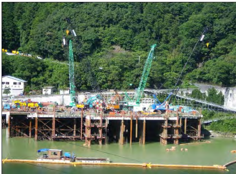
7月15日 仮設構台設置、呑口立坑掘削