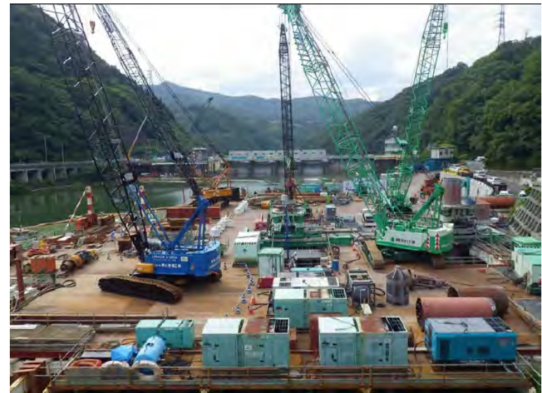
7月8日 仮設構台設置、呑口立坑掘削