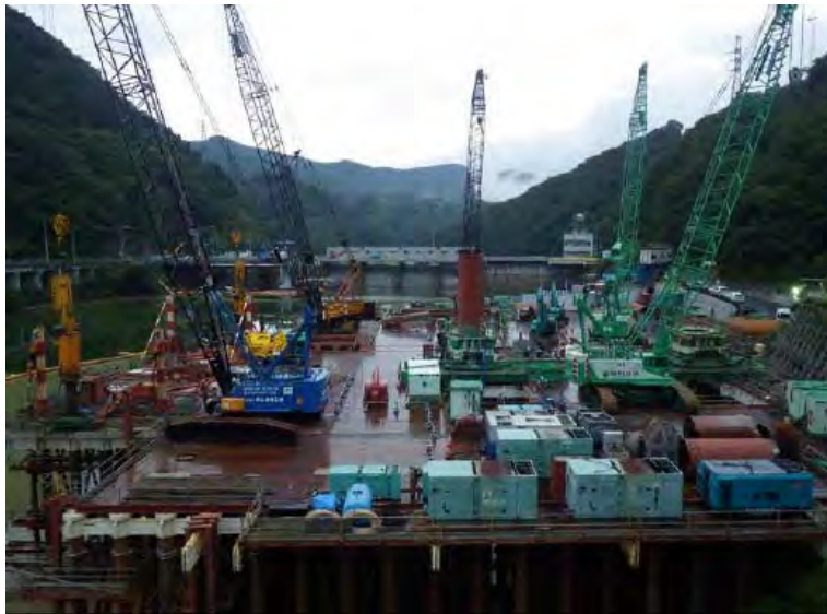
7月1日 仮設構台設置、呑口立坑掘削