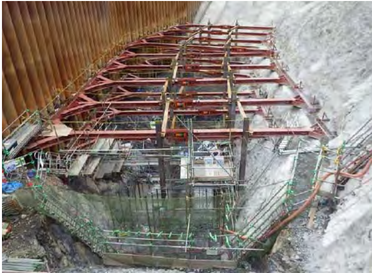
7月1日 鉄筋組立、コンクリート打設