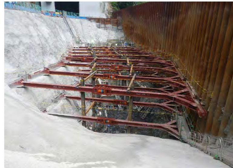
7月22日 鉄筋組立、コンクリート打設