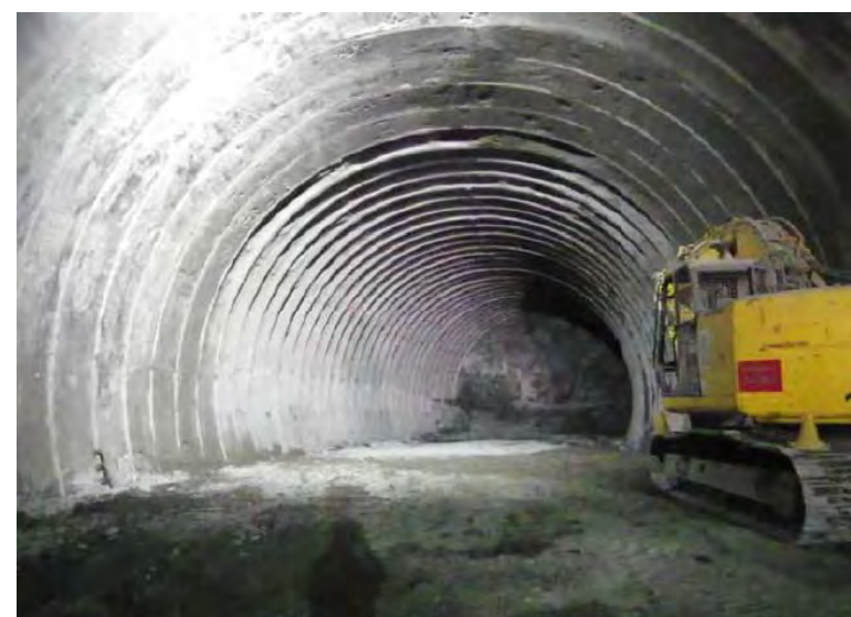
7月22日 上半掘削 264m 下半204m 基礎114m