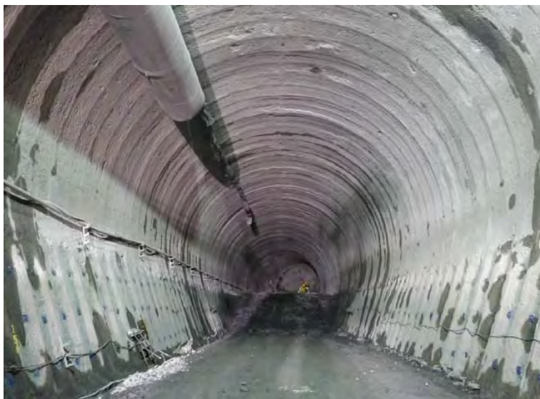
7月15日 上半掘削 248m 下半190m 基礎114m