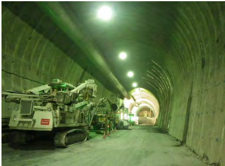
7月1日 上半掘削 234m 下半145m 基礎114m