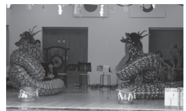
まめっこ神楽部による神楽

はじめに、まめっこ神楽部(子どもたちによる神楽)のみなさんの神楽の舞い、よさこい踊りなどが披露されました。子どもたちは照れくさそうにしながら一生懸命踊っていました。その後、愛媛県の無形民俗文化財である、「山鳥坂 鎮縄神楽」の演舞です。鎮縄神楽は厳かな雰囲気を作り出され、その舞いは威風堂々としていたため、出席者全員がその演舞に引き込まれていきました。(表紙の写真)