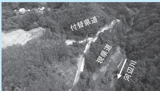
菟野尾地区 付替県道工事