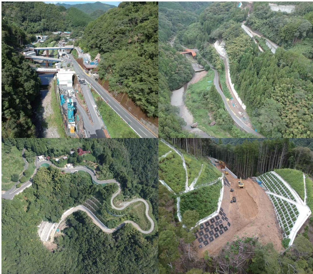
左上：上鹿野川地区／右上：下敷水地区／左下：見の越地区／右下：菟野尾地区

国土交通省 四国地方整備局 山鳥坂ダム工事事務所 TEL 0893-34-3000 FAX 0893-34-3358