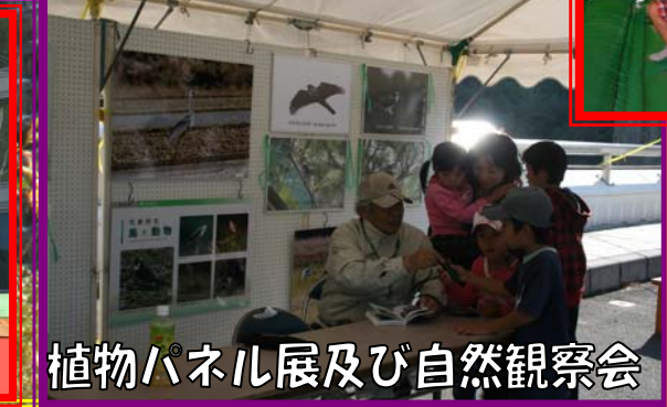
植物パネル展及び自然観察会