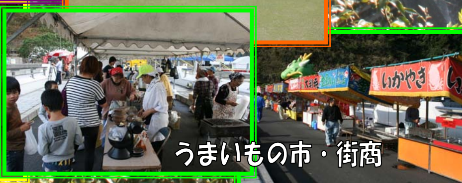
うまいもの市・街商