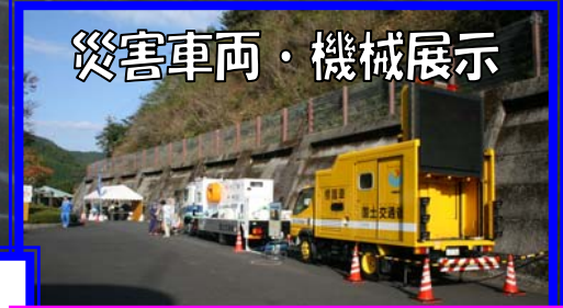
災害車両・機械展示