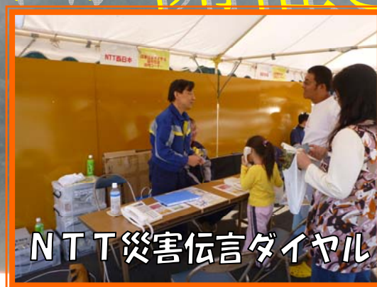
NTT災害伝言ダイヤル