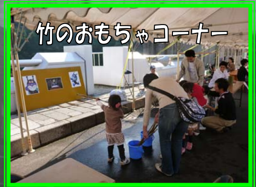
竹のおもちやコーナー