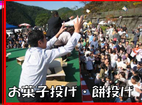
お菓子投げ・餅投げ