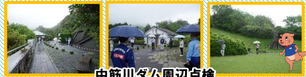
中筋川ダム周辺点検