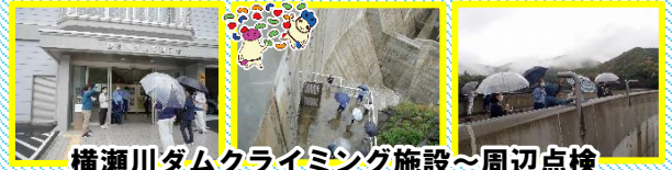
横瀬川ダムクライミング施設～周辺点検

点検当日は、あいにくの雨でしたが、普段は気づきづらい雨の日ならではの危ない箇所（すべりやすい等）を発見することができました！