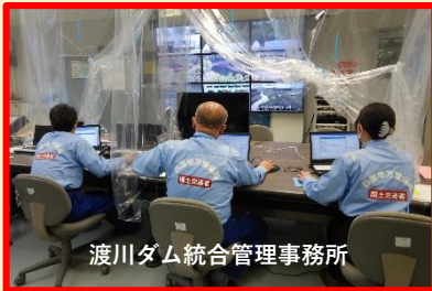
渡川ダム統合管理事務所