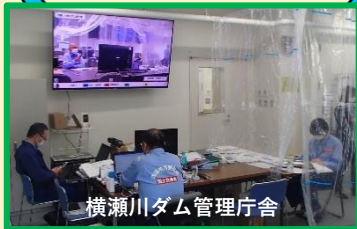
横瀬川ダム管理庁舎