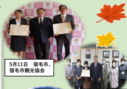
5月11日 宿毛市、宿毛市観光協会

土佐三原どぶろく合同会社は、中筋川ダムに貯蔵したどぶろくの方の企画、販売に尽力され、ダムを活用した地域振興として多くの方が知るきっかけとなり建設業界の魅力向上に貢献されました。5月11日、12日にそれぞれ事務所長より表彰状の授与を行いました。