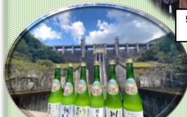
5月12日 土佐三原どぶろく合同会社