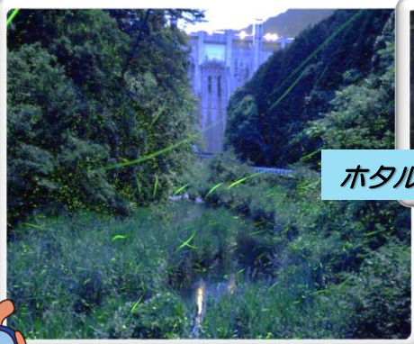
ホタルの飛び交う様子