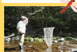
ムカシトンボを発見！