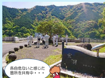
事務所～ダムの堤体

中筋川ダム周辺の公園や川辺等で、安全利用点検を実施しました。事務所職員・公園管理者の宿毛市・三原村が共同で一般の方々の視点で危険な箇所や対策できることはあるかを思慮しながら見回りを行い、改善点等を確認しました。ご利用の際は、コロナ対策はもちろん、天気の変化や川の流れにも十分にお気をつけください。