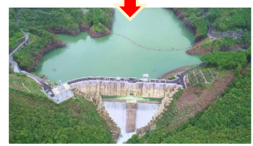
貯留後EL 134.56m (7月4日)