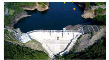
貯留前 (平常時) EL131.9m