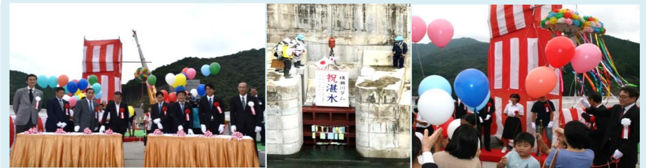
ボタンが押され閉塞ゲート降下