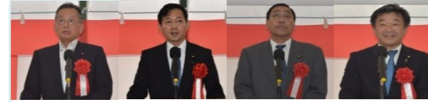
山本衆議院議員 広田衆議院議員 中西参議院議員 足立参議院議員