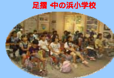
足摺 中の浜小学校