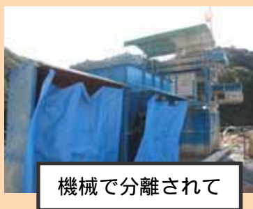
機械で分離されて