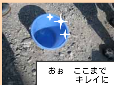
おお ここまでキレイに

水中の濁りの粒子同士がくっつきやすくなる薬品を使って濁りの粒子を固めて沈殿させるのね