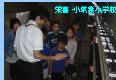
栄喜 小筑紫小学校