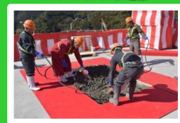
コンクリート締め固め