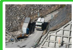
ダンプトラックでコンクリートを運搬