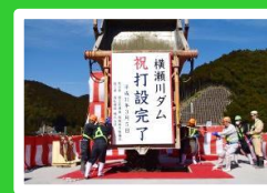
コンクリート放出