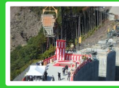
タワークレーンで天端へ運搬