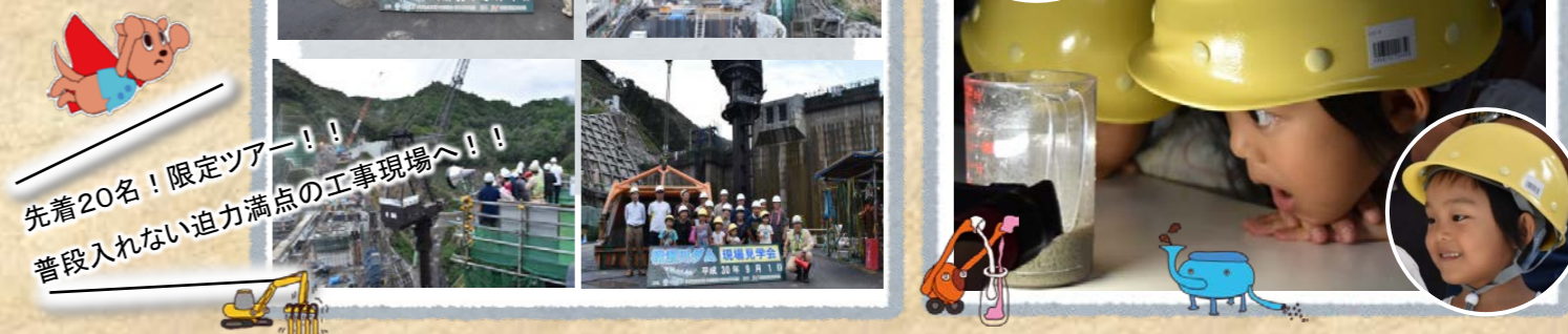
先着20名！限定ツアーー！！ 普段入れない迫力満点の工事現場へ！！