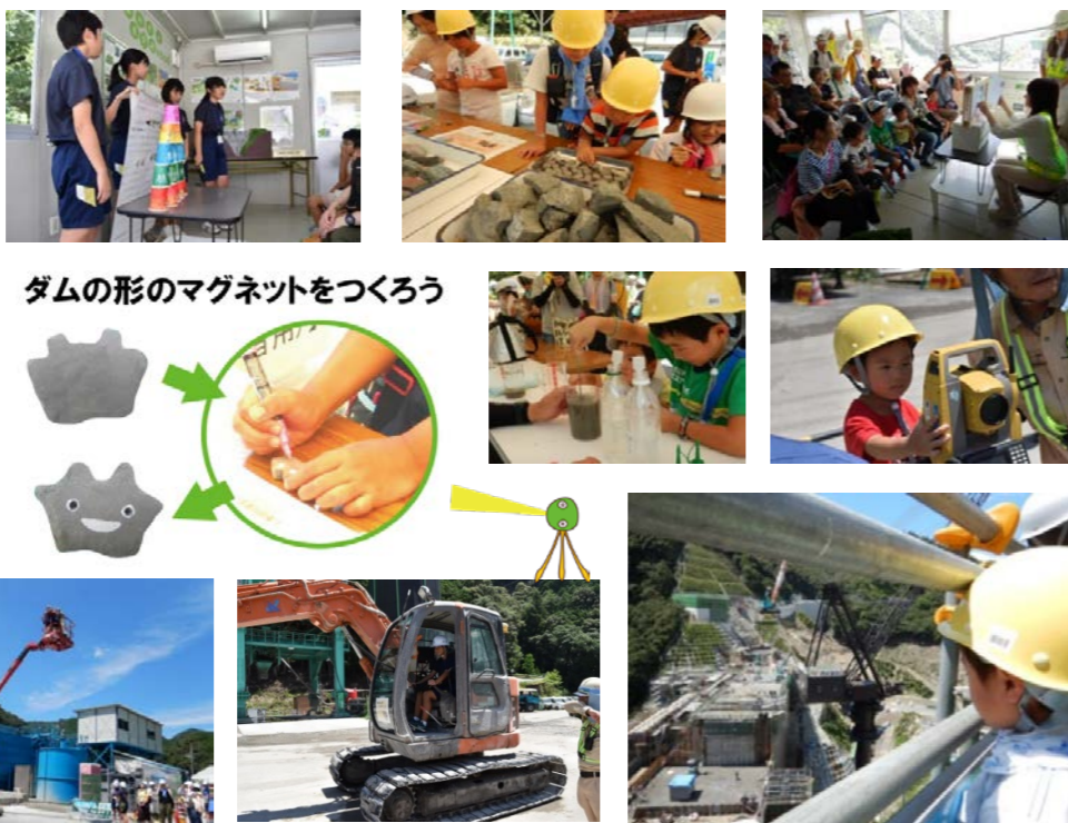
ダムの形のマグネットをつくろう