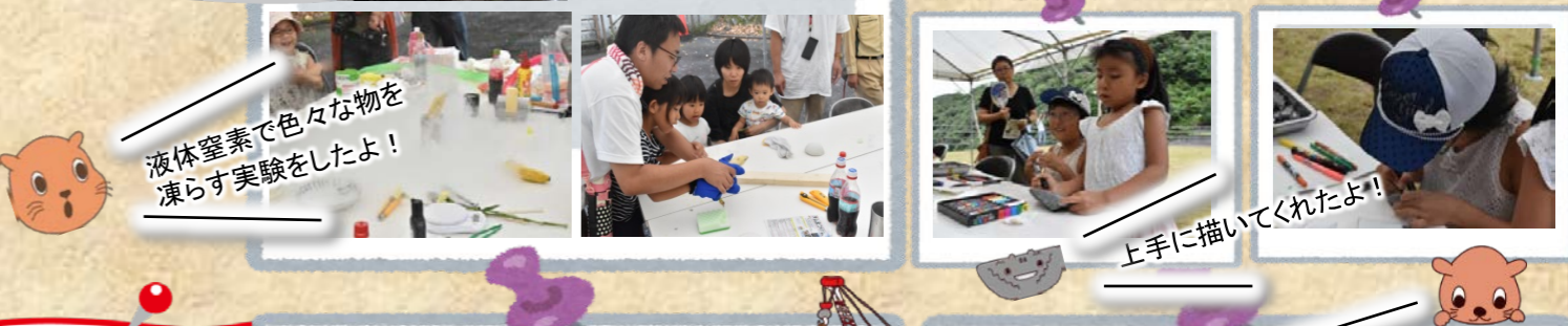
液体窒素で色々な物を凍らす実験をしたよ！