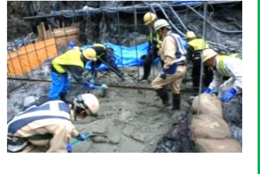
▲初めてのコンクリート放出

ダンプトラックで製造設備から運ばれたコンクリートをバケツに投入、クレーンで打設場まで運び、所定の位置で放出した後、参加者全員で万歳三唱を行い、初打設を祝いました。