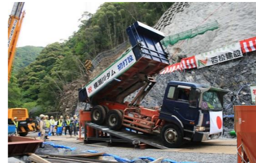
▲お祝いダンブでコンクリートを運搬