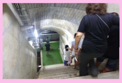
トンネルのような階段と通路を通り探検の始まりです。