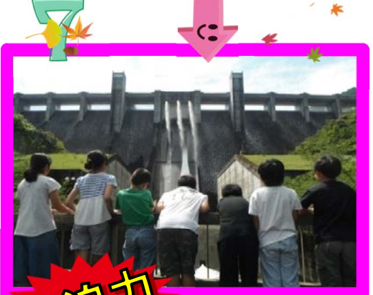
大迫力 の洗浄放水