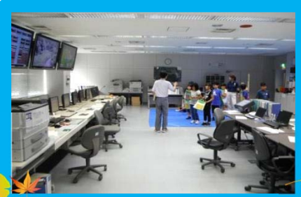
操作室にはたくさんのモニターとパソコンがあります。