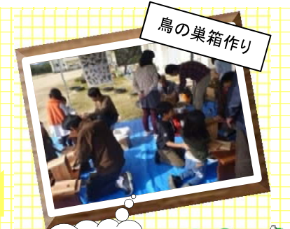
鳥の巣箱作り 巣箱作りのブースはいつも大人気!

一地域のイベントにも参加しています ○みはら祭り (8月15日) ○つるの里まつり(12月2日) ○葉の花祭り (3月上旬) お気軽にお立ち寄りください◎