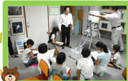
模型を使って水力発電の仕組みも学べます。