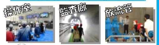
操作室 監査廊 放流管 などなど...この他にも色々な設備が見られます!