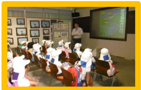
スライドを使ってダムの成り立ち、目的、大きさなどの説明を聞きます。

中筋川ダムでは、ダム内部見学を随時受け付けております(平日9:00~16:00、5名様~)。見学のお申し込みは電話にて、ご希望日の1週間前までにお願い致します。ダムの仕組みや役割、各設備、ダムの中などを見学することができます。普段目にするのできないダムの内部を見に来ませんか。どうぞお気軽にダム管理庁舎にご連絡下さい。