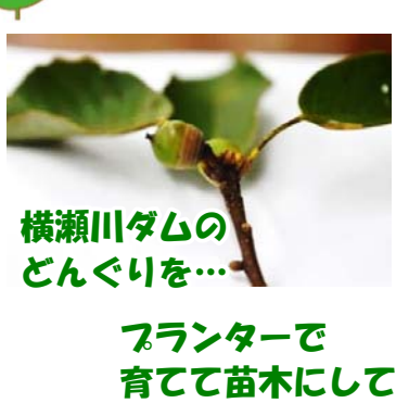
横瀬川ダムのどんぐりを... プランターで育てて苗木にして...

横瀬川ダムをつくる場所にはたくさんのどんぐりの木がありますが、そのままではダムの湖に沈んでしまったり、どうしても切られたりしてしまいます。どんぐりの木を一本でも多く横瀬の山に残し、動物たちの食料として育てていきたい...そんな思いからどんぐりの木を引っ越しすることにしました。