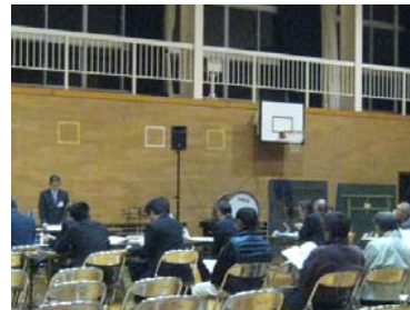
中筋中学校体育館

「ダム建設事業の検証に係る検討報告書(素案)に対する関係住民の意見を聴く場」が開かれました。この場で頂いたご意見は今後の報告書(原案)に反映させていただきます。