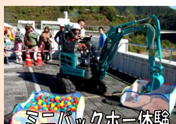
ミニバックホー体験