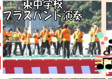
東中学校 フラスバンド演奏