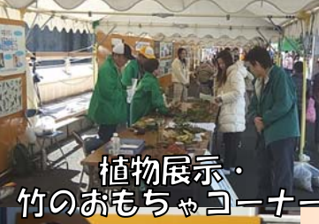
植物展示・ 竹のおもちゃコーナー