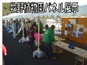
牧野植物園パネル展示