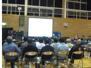
中筋中学校体育館

10月25日の検討の場の結果を受け、「ダム建設事業の検証に係る検討報告書(素案)」が作成されました。これに対する関係住民の皆さんの意見を聴くにあたり、報告書(素案)への理解を深めていただくための説明会を行いました。