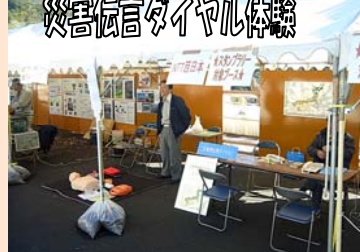
災害伝言ダイヤル体験