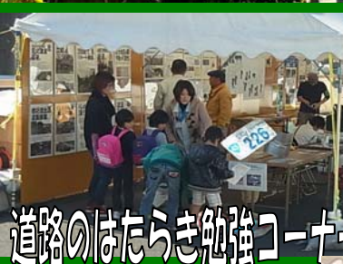
道路のはたらき勉強コーナー