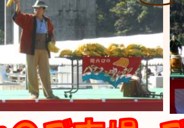
間六口さん パナソニックのたたき売り