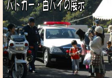
ハトカー・白バイの展示