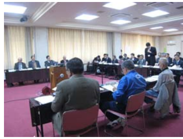
四万十市社会福祉センター

「ダム建設事業の検証に係る検討報告書(素案)に対する学識経験を有する者から意見を聴く場」が開かれました。この場で頂いたご意見は関係住民の方の意見同様に今後の報告書(原案)に反映させていただきます。