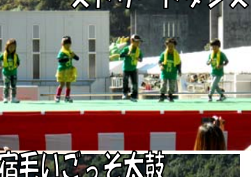
ソウルクリーム ストリートダンス