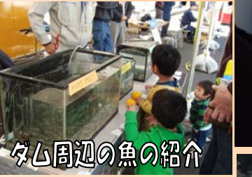
ダム周辺の魚の紹介