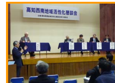
パネルディスカッションの様子。