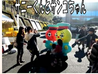
クニくん&コウちゃん