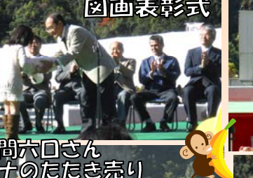
式典・ 図画表彰式