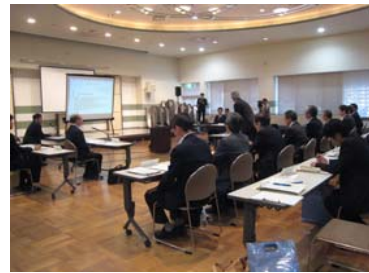
高知市保健福祉センター

「横瀬川ダムの検証にかかる検討の場」が開かれました。検討の場には、高知県知事、四万十市・宿毛市両市長、四国地方整備局長が出席し、8月9日の幹事会で抽出された13のダム以外の対策案とダム案の検討をした結果、ダム建設が最も有利という提示がされました。引き続き、対応方針(案)を検討していきます。