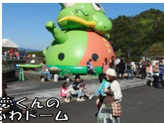
ドラえくんの ふわふわドーム