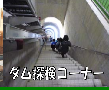
ダム探検コーナー