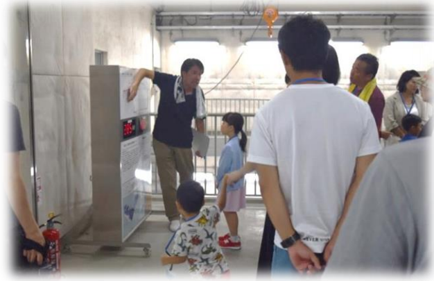
発電機等のダム管理施設の見学