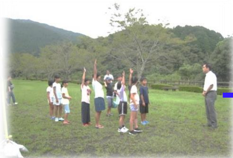
開会式(梅の木公園出発)