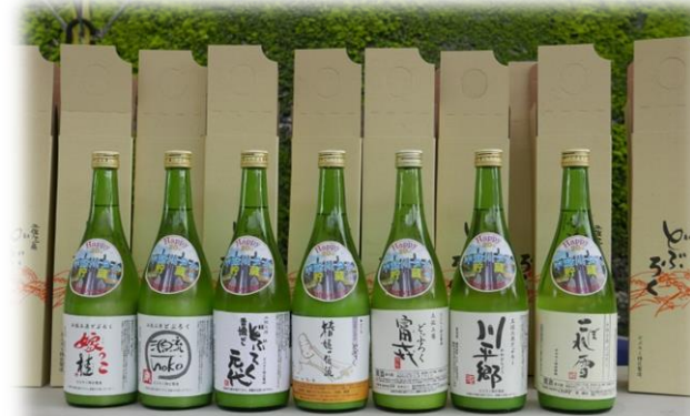
ダム貯蔵のどぶろくを蔵出し