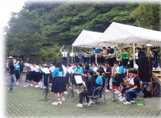
幡多地方の中学生による合奏

四万十市立中村西中学校 四万十市立西土佐中学校 宿毛市立東中学校 宿毛市立宿毛中学校 宿毛市立片島中学校 大月町立大月中学校