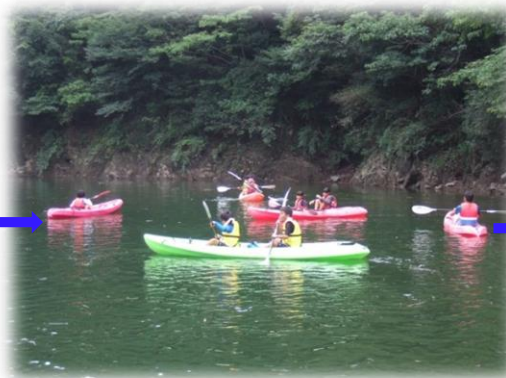
ダム湖でカヌー体験