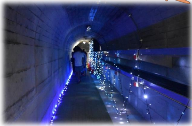
ダム内部イルミネーション