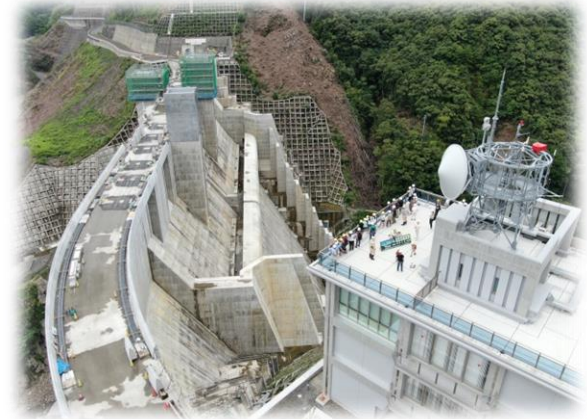
管理庁舎屋上からダムを見学