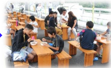
夕食(カレーライス)