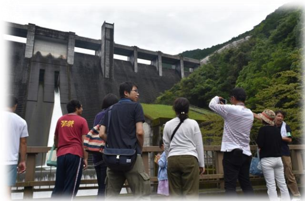
見上げ橋から見たダム