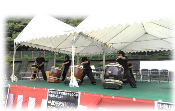
オープニングを飾ったあしづい太鼓