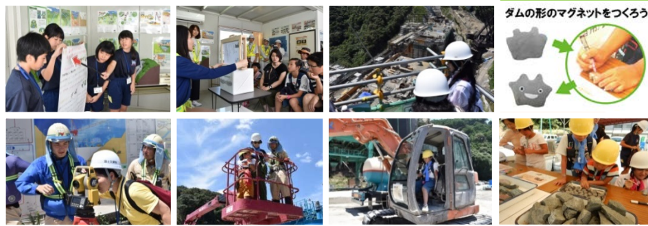
ダムの形のマグネットをつくろう