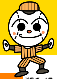
球場 ボール君 ©やなせたかし