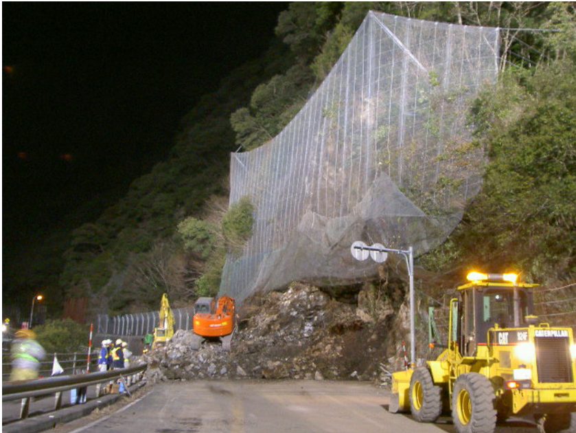
【土砂撤去作業(夜間)】