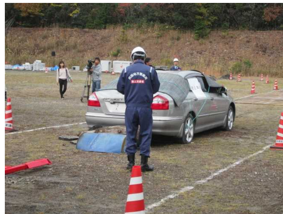
車両移動前の記録