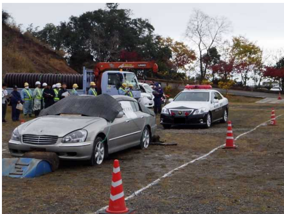
警察パトロールカーによる情報収集