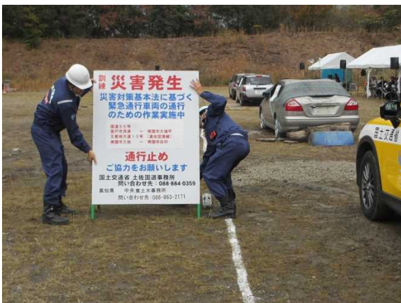
道路区間指定の周知看板を設置