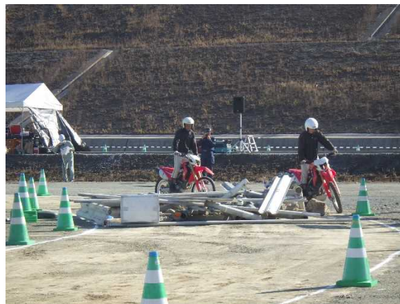
交通機動隊バイクによる情報収集