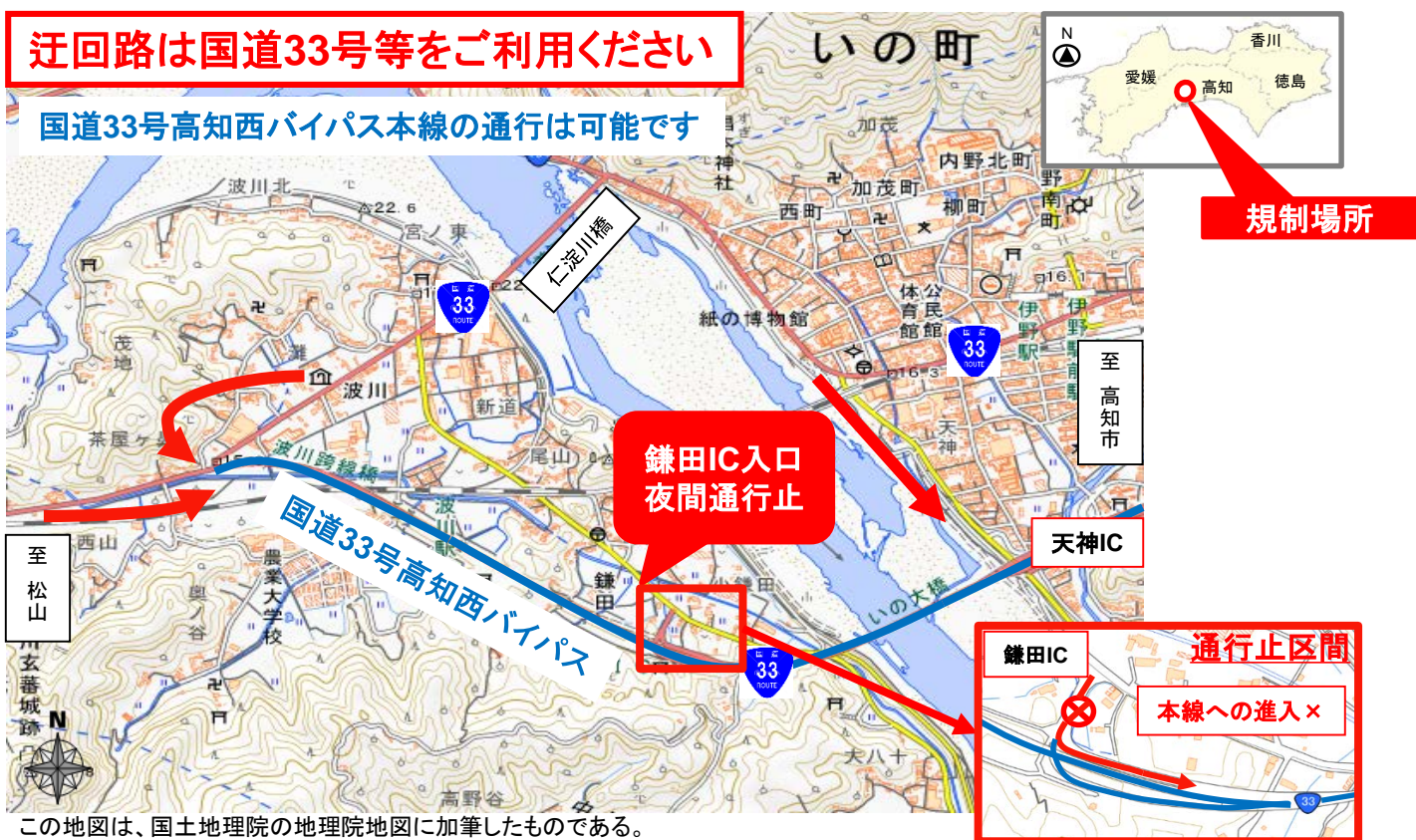
この地図は、国土地理院の地理院地図に加筆したものである。