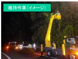
維持作業 (イメージ)