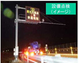
設備点検 (イメージ)