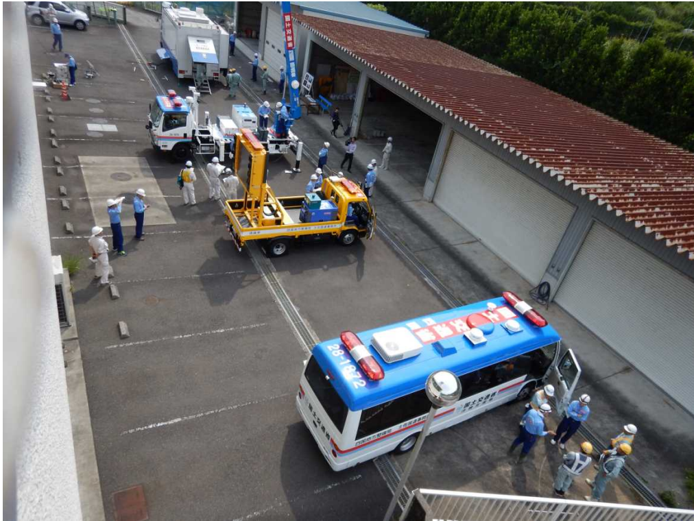
奥から 対策本部車、照明車、標識車、待機支援車