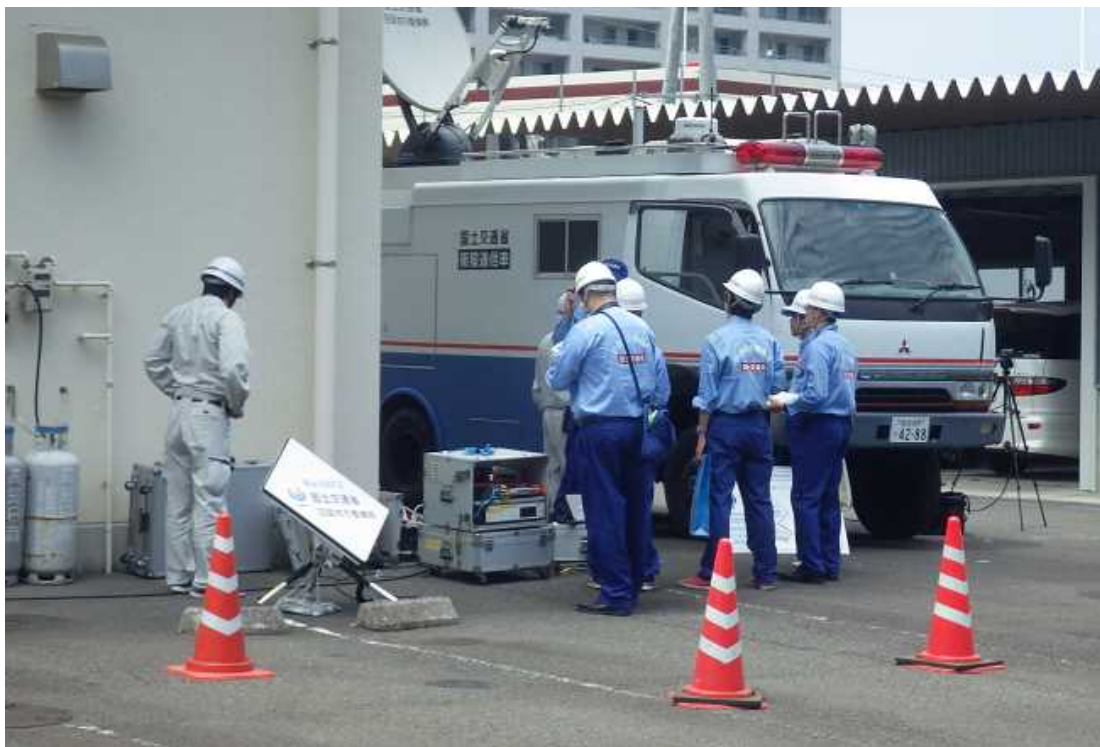
[奥]衛星通信車、[手前]可搬型衛星通信装置