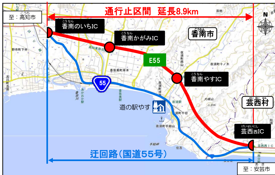
この地図は、国土地理院の地理院地図に加筆したものである。

○問い合わせ 国土交通省 土佐国道事務所 088-884-0359 日本道路交通情報センター（高知情報）050-3369-6639