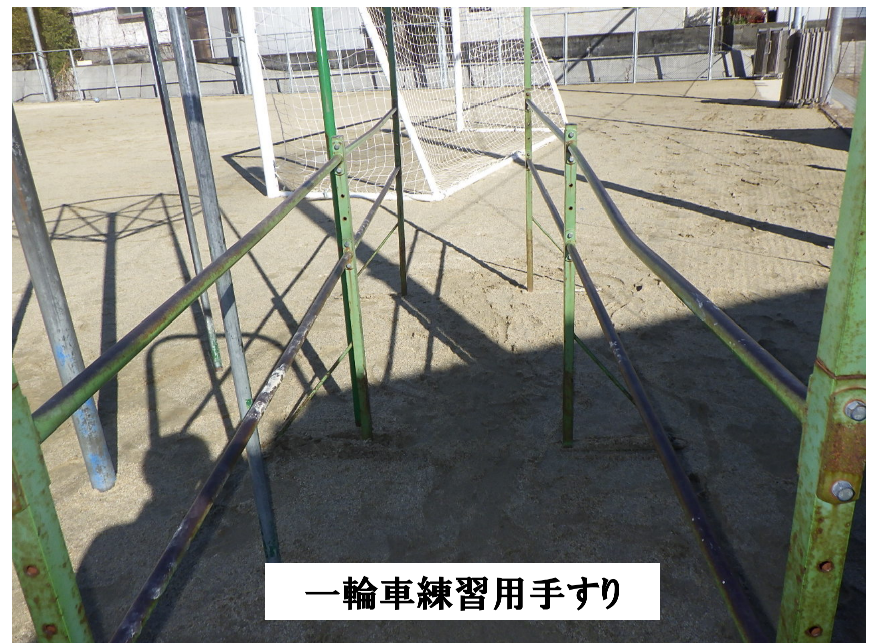
一輪車練習用手すり