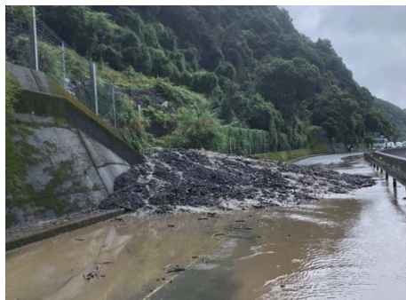
国道への土砂流入