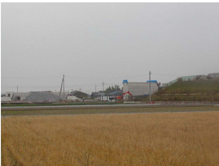
▲竹中地区工事状況