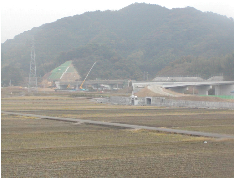
▲唐谷地区工事状況