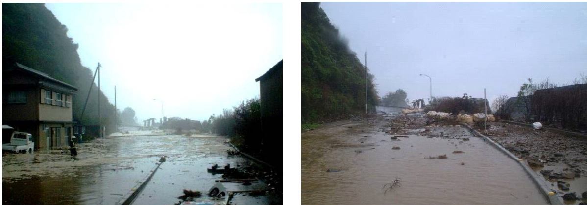
▲台風の越波により冠水し通行止めとなった高知県安芸市大山岬付近（平成16年10月）