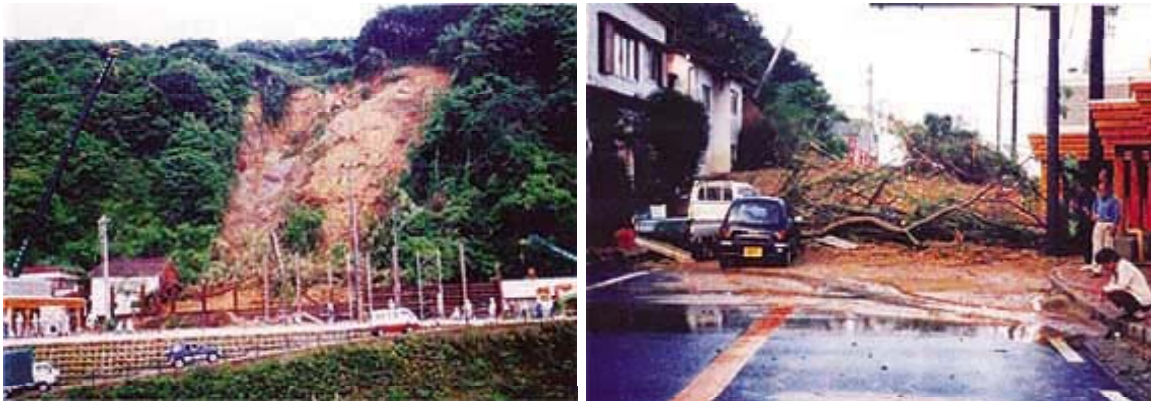
▲土砂災害で車道が通行止めとなった高知県安芸市大山岬付近（平成10年5月）

今回の大山道路（L=2.0キ ロ ）は、平成16年度に事業化され鋭意事業を進めており、人々の日常の安全・安心な暮らしを支え、また、災害時の避難活動・緊急輸送路として重要な役割を担う、県東部地域の「命の道」の整備となります。