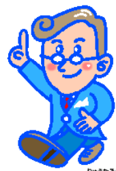
イメージキャラクター