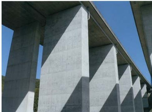
コンクリート巻き立て 施工完了