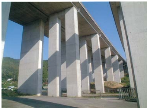
コンクリート巻き立て 施工前