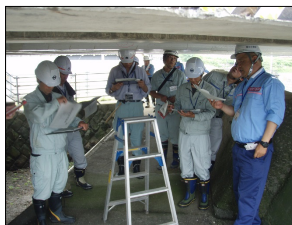
【 実習の様子 】

※参加者23名は、午前中に「定期点検要領」や「橋梁点検の概要と健全性の診断」について受講しました。午後からは実習として、実際にハンマーによる打音点検や、クラック幅の測定を行い、点検結果を様式に記入するなど、橋梁点検の実務を体験しました。