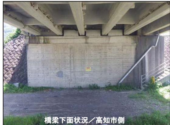
橋梁下面状況／高知市側