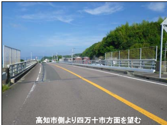
高知市側より四万十市方面を望む

橋種：3径間単純PCホーストT桁橋、3径間単純PCプレント桁橋 橋長：63.3m 供用年：昭和45年(1970年)3月