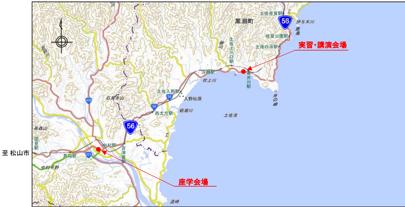
「国土地理院の地理院地図を加工して作成したものである。」