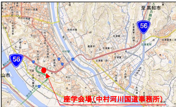
「国土地理院の地理院地図を加工して作成したものである。」