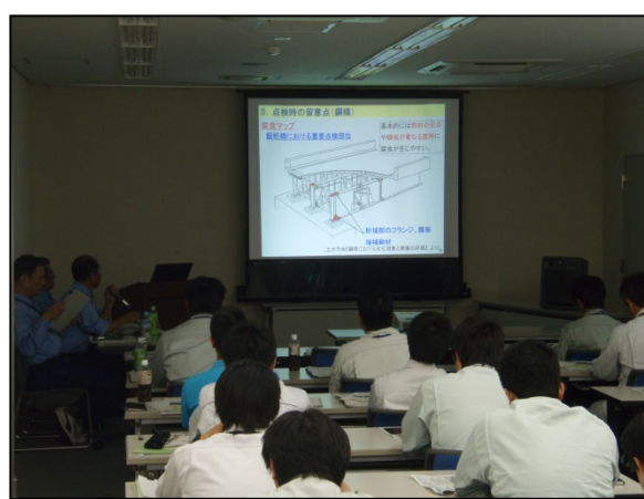
【 座学の様子 】