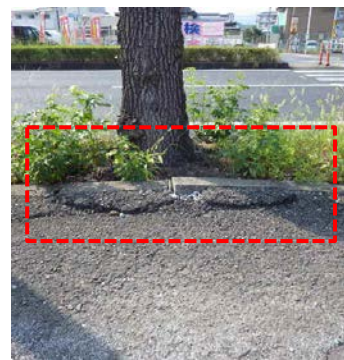
歩道側の縁石損傷