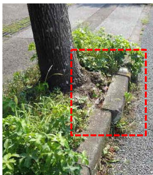
車道側の縁石損傷