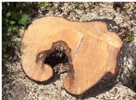
幹半径より深い空洞を確認