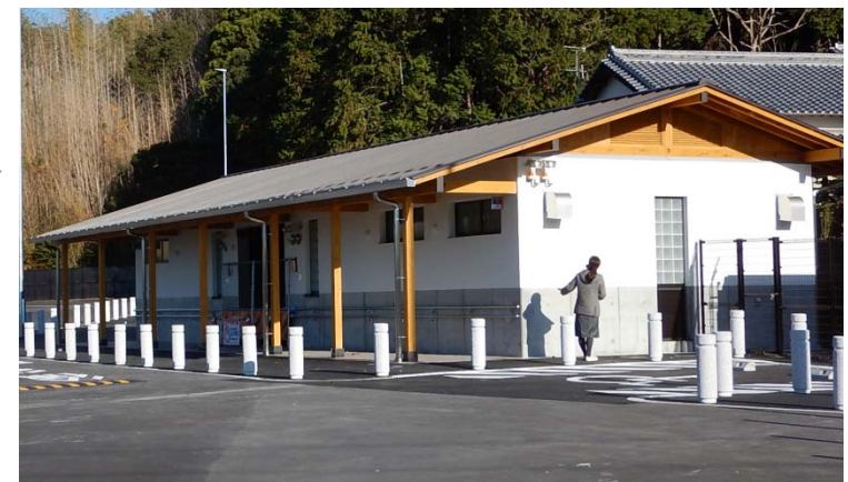
・②今回整備エリア(トイレ棟)