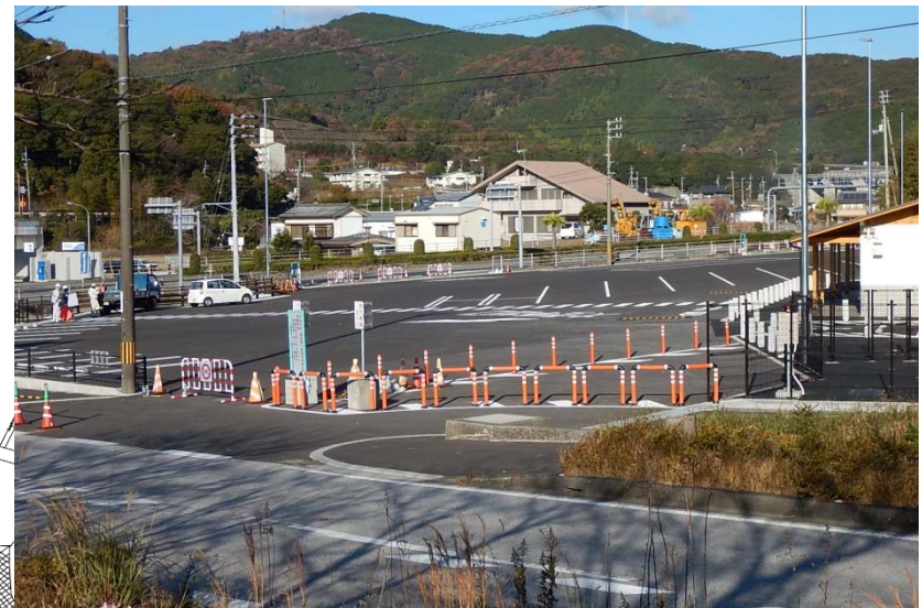
・①今回整備エリア(駐車場全景)