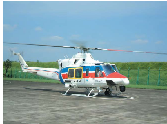
災害対策用ヘリコプタ