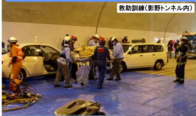
救助訓練(影野トンネル内)

開通済み区間の高知自動車道(中土佐IC~四万十町中央IC間)で開通前に実施された合同訓練実施事例 (実施日H24.12.4)