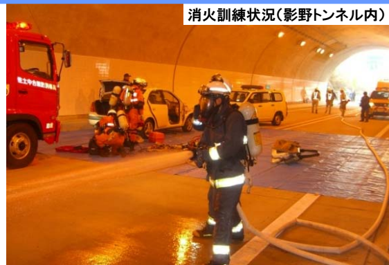
消火訓練状況(影野トンネル内)