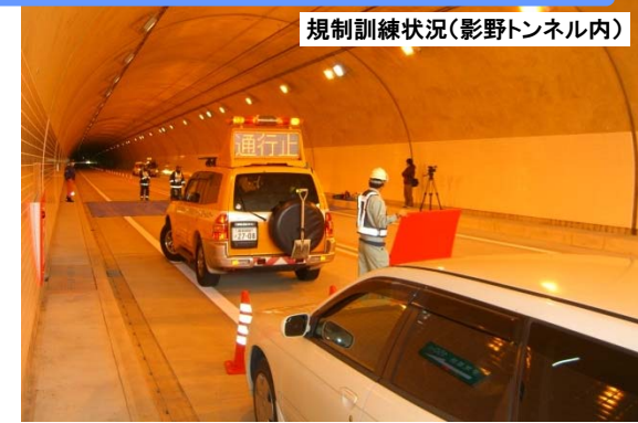
規制訓練状況(影野トンネル内)