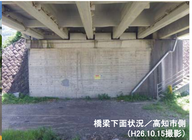
橋梁下面状況／高知市側 (H26.10.15撮影)