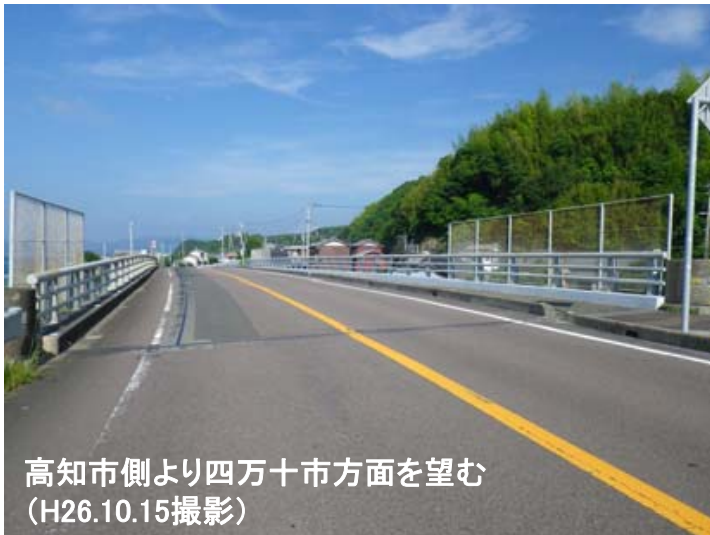
高知市側より四万十市方面を望む (H26.10.15撮影)

橋種：3径間単純PCホーステン桁橋、3径間単純PCプレテン桁橋 延長：63.3m 供用年：昭和45年(1970年)3月