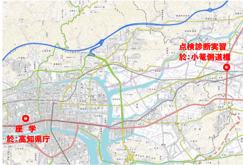
図1 実習会場位置図