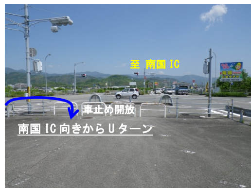
写2 臨時駐車場進入口