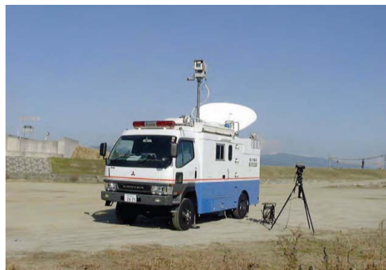
被災地から専用の衛星回線を使い映像を配信する衛星通信車