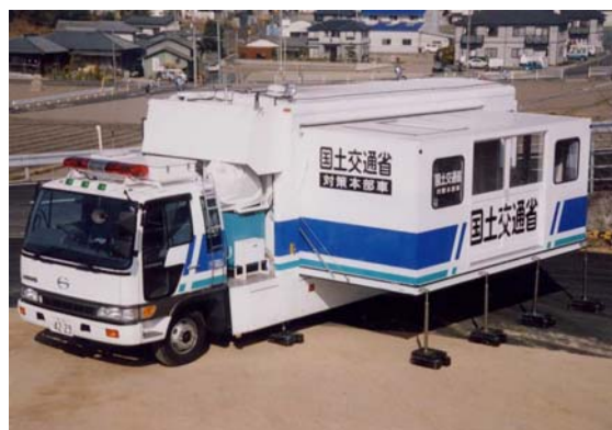
通信施設やトイレなどを備えている対策本部車